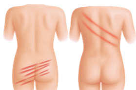
Otisky po bití rákoskou, opaskem