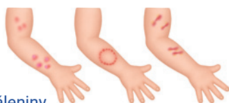
Popáleniny od cigarety