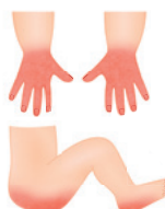
Popálenina od násilného ponoření do horké vody ( ostré ohraničené okraje )