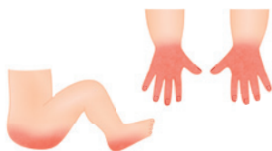
Popálenina od násilného ponoření do horké vody (ostré ohraničené okraje)