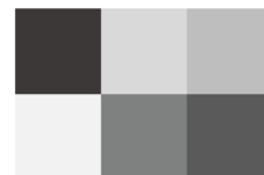
PRACOVNÍ SKUPINA URGENTNÍ ULTRASONOGRAFIE Společnost urgentní medicíny a medicíny katastrof ČLS JEP